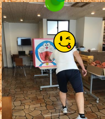
どら焼き入れ from MJ所沢