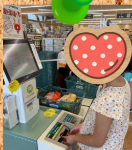
おやつのお買い出しの お手伝い