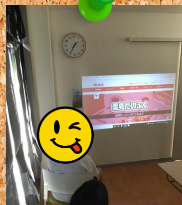
工場見学シアター In MJ入間