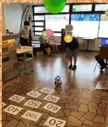
ヤカンリング 真剣勝負!