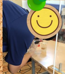
モクテル作りに挑戦