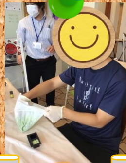
バスボム作り and 爆水!