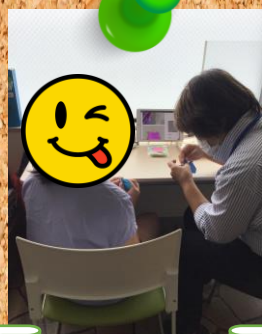
すみっこぐらし キャラ作りby折り紙