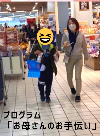
プログラム 「お母さんのお手伝い」

ぱれっとの職員一同、うさぎのように元気にぴんぴん跳ねて頑張っていますので、よろしくお願ひ致します