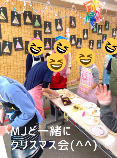
MJと一緒に クリスマス会(^^)