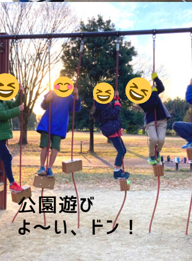
公園遊び よ〜い、ドン!