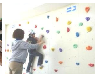
キッズサポートぱれっと (狭山市)