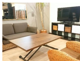
アカリリゾート (狭山市)

福祉や医療業界に特化した人材サービスを行っております。高齢者施設・障害者施設・医療機関などへ「人材紹介」「人材派遣」「採用代行」等のメニューをご用意して採用に関する課題解決のお手伝いをいたします。業界の資格を持った専任のコンサルタントが募集から就業後のフォローまで一貫してきめ細やかな対応を行っています。