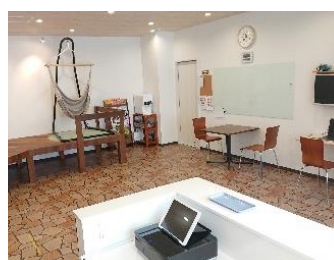
スタディサポートMJ (狭山市)