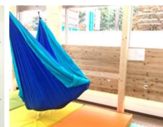
キッズサポートにじいろ (狭山市)