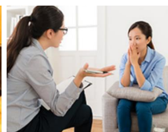
相談支援センター 優愛(狭山市) ケアプラン優愛 (狭山市)