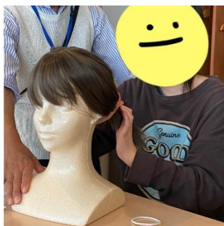
ヘアアレンジ講座