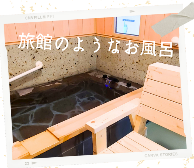
旅館のようなお風呂