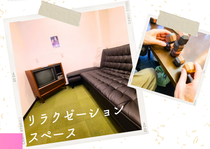
リラクゼーション スペース