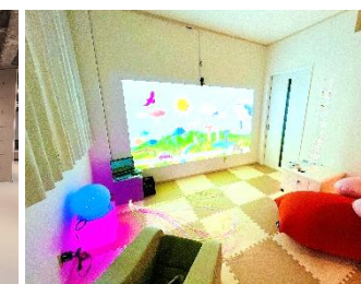
生活介護ナチュラル (狭山市)