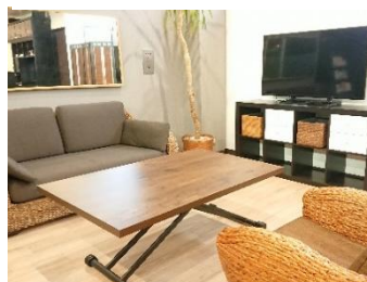
アカリリゾート (狭山市)