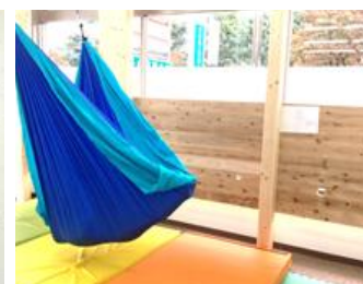
キッズサポートにじいろ (狭山市)