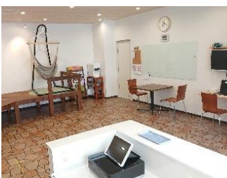
スタディサポートMJ (狭山市)