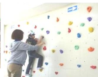
キッズサポートぱれっと (狭山市)